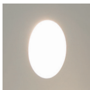
UGR<19 (X=4H, Y=BH, S=0.25H) Direct ca. 100%