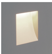
UGR<19 (X=4H, Y=8H, S=0.25H) Direct ca. 100%